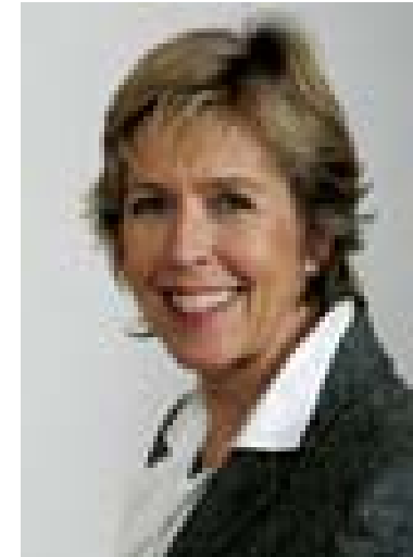
Helse- og omsorgsminister Anne-Grete Strøm-Erichsen