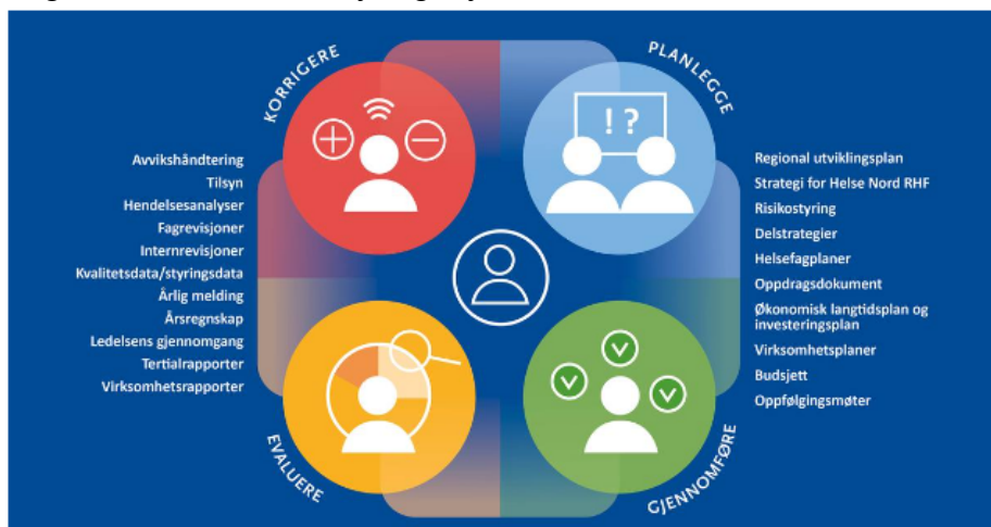
Figur 1 Helhetlig styring og rapportering

Figur 1 viser elementene i Helse Nords helhetlige styringsprosess hvor rapportering inngår som en del av styringssystemet.